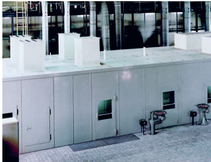
Turbinenkapsel in einem Kraftwerk

Neben konstruktiven Veränderungen der Maschinen sind Sekundär-Schallschutzmaßnahmen oftmals die einzige Möglichkeit, die Schallpegel auf ein erträgliches Maß zu reduzieren.