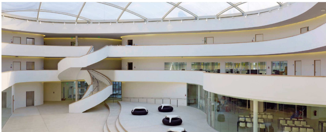
Absoluter Blickfang im Schulgebäude ist das Atrium mit seinem Treppenaufgang.