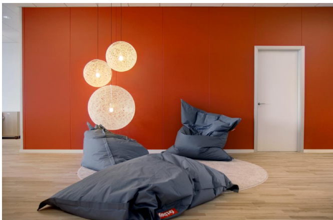
DEKO PF - Die profilmfreie Systemwand