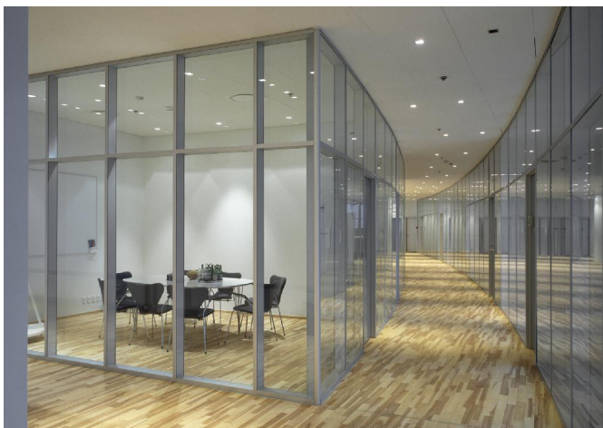
DEKO GV - Doppelglaswand mit hoher Schalldämmung