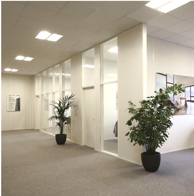
DEKO PV - Die klassische Systemwand