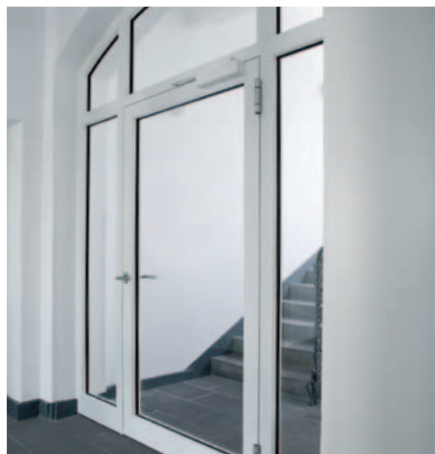
Brandschutztür mit Segmentbogen