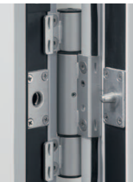
Türband Brand- und Rauchschutztüren

Unsere Aluminium-Fenster und Fassadensysteme eignen sich sowohl für den Neubau als auch zur Nachrüstung bestehender Objekte.