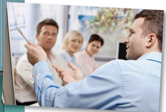
Mensa Hannah-Arendt-Gymnasium – Individuelle Glasfassade mit Alu-Rohr-Profilen und Sonnenschutz-Raffstoreanlage

Nutzen Sie unsere Erfahrung zur Lösung Ihrer Probleme. Unser Team steht Ihnen gerne zur Verfügung.