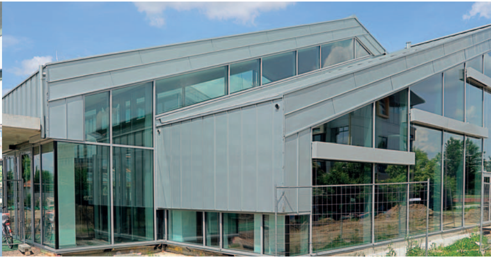
Mensa Hannah-Arendt-Gymnasium – Aluminium-Pfosten-Riegel-Konstruktion und Sonnenschutz-Raffstoreanlagen