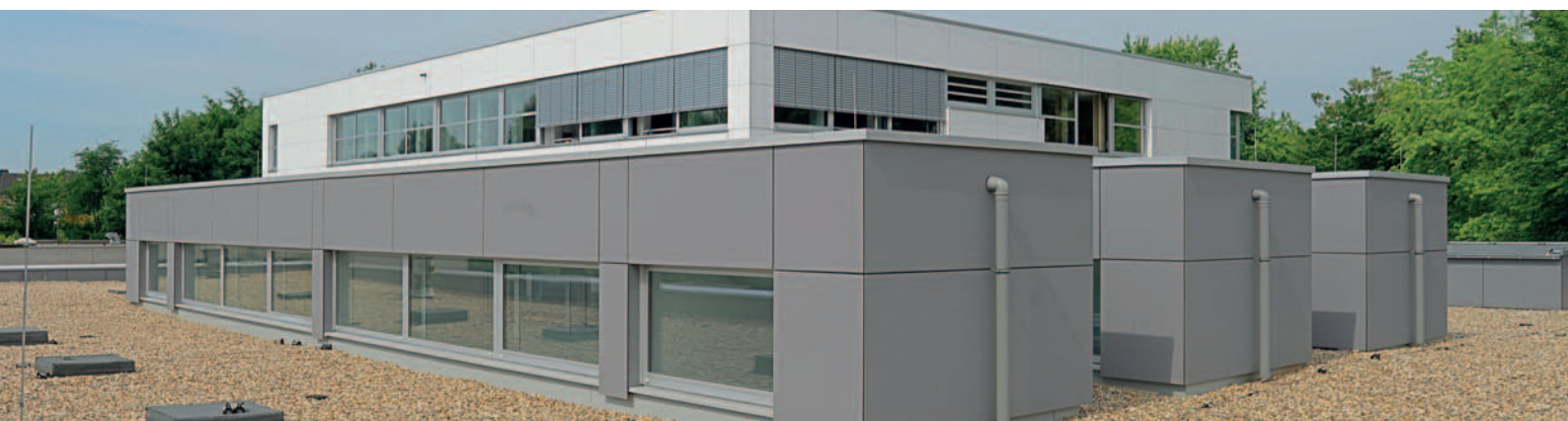
Gymnasium Wülfrath – Aluminium-Fenster mit innenliegenden Verdunklungsrollos und Trespa-Fassadenplatten