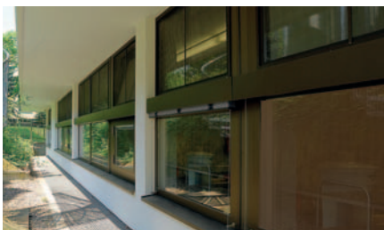
Gymnasium Wülfrath – Hebe-Schiebe-Anlagen mit Trespa-Fassade, inkl. Sonnenschutzanlagen