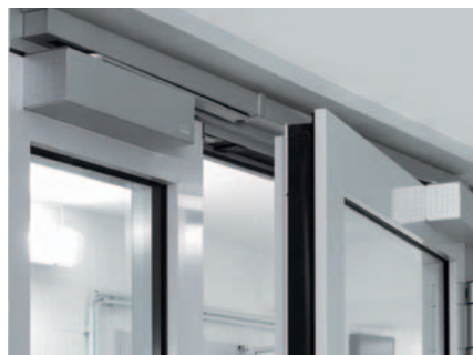
Brandschutztür mit Feststellanlage