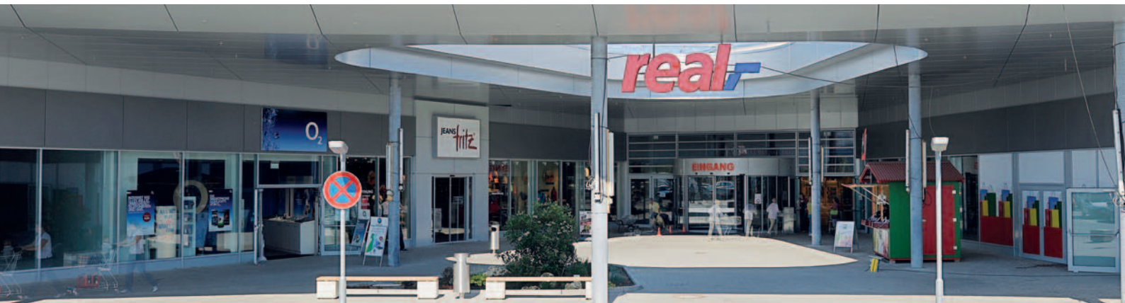
Real-Markt, Schaufenster- und Eingangsanlage – Aluminium-Pfosten-Riegel-Konstruktion, Karusselltür und Lamellenfenster aus Sicherheitsglas

Unsere Aluminium-Fenster und Fassadensysteme eignen sich sowohl für den Neubau als auch zur Nachrüstung bestehender Objekte.