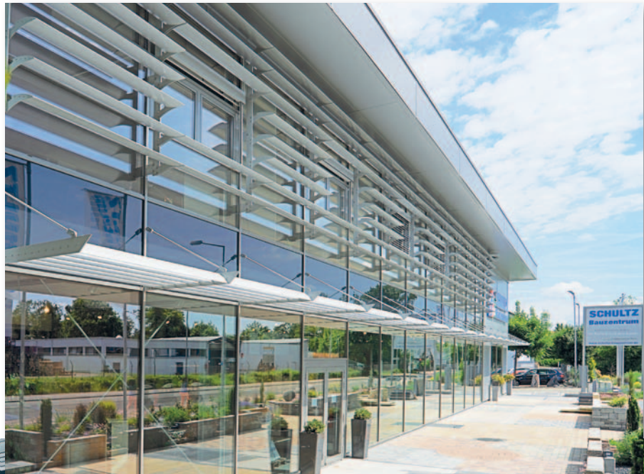
Bauzentrum Schultz – Fassadenkonstruktion mit Ansichtsbreite 50 mm und Sicherheitsglas; Sonnenschutzlamellen vertikal und horizontal angeordnet